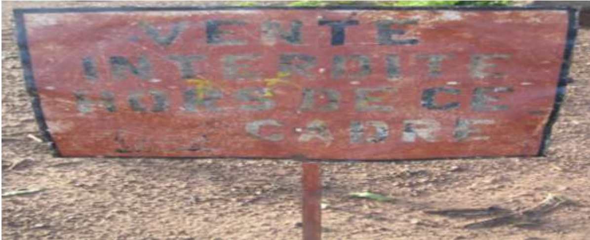
Photo 2 : plaque de délimitation de la zone de vente du marché de bétail de Nièna