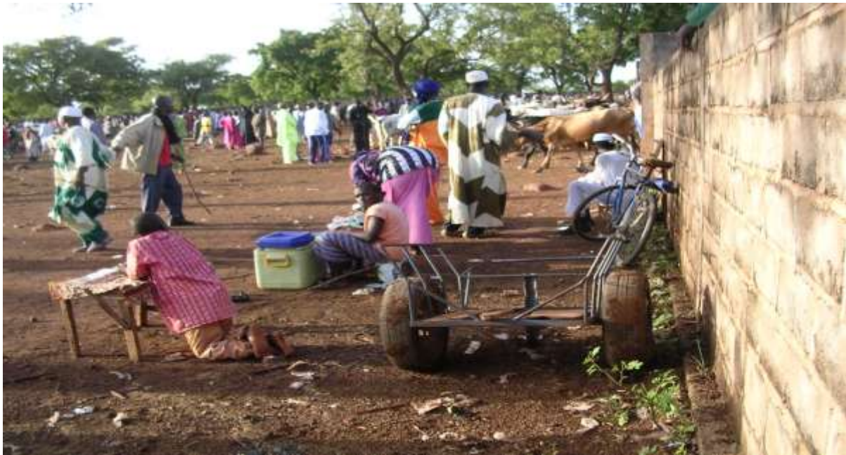
Photo 3 : vendeuses de jus de gingembre, de bissap autour du marché à bétail de Niéna