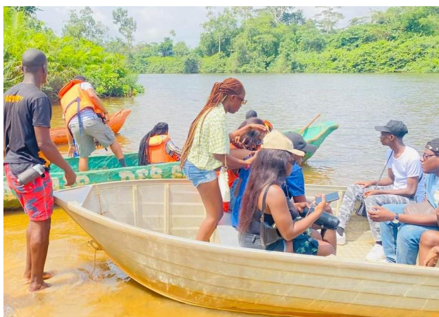
Photo 5 : Moyens de transport pour la balade fluviale : pirogue traditionnelle (vert) et pirogue à moteur (blanc)

Au-delà de ces avantages, il est nécessaire d'analyser ces pratiques écotouristiques pour évaluer leur niveau d'intégration des principes du tourisme durables. Ce dernier vise à minimiser l'impact négatif sur l'environnement, la culture et les communautés locales tout en maximisant les bénéfices économiques, sociaux et environnementaux (OMT, 2024, p 5). Les principes incluent la gestion des ressources naturelles de manière responsable, le respect de la culture locale et la promotion de l'équité économique. Au regard de ces principes, les résultats montrent que, malgré des efforts initiaux, certaines pratiques observées laissent percevoir un décalage avec le tourisme durable. Les principaux indicateurs de non-conformité aux principes du tourisme durable ont été identifiés à travers trois critères : l'impact environnemental, la gestion des ressources naturelles et l'interaction avec les communautés locales. En effet, l'enquête de terrain relève que l'une des principales activités touristiques à Nero Mer est la balade fluviale en pirogue. Cependant, l'utilisation intensive de pirogues à moteur (Photo 5) soulève des préoccupations environnementales significatives.