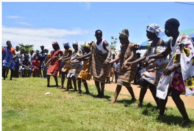
Photo 4 : Vue de l'exécution de la danse bolo par des visiteurs dans le village Néro Mer-Gboupé